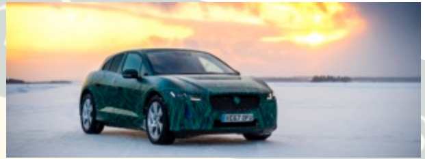
Jaguar I-PACE: Schnellladefunktion auch bei arktischen Temperaturen (Seite 3)