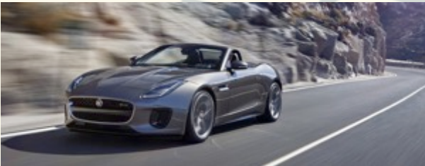
Jaguar F-Type mit Doppelpack bei den „Best Cars“ 2018 von ‚auto motor und sport‘ (Seite 4)