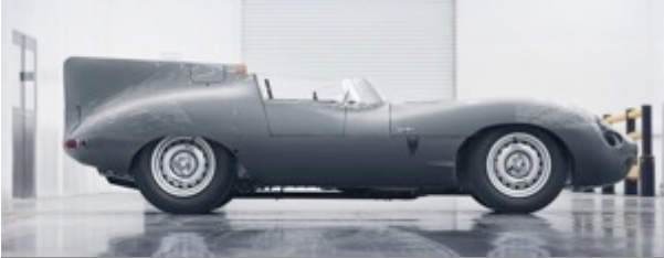
Jaguar setzt die Produktion des legendären Rennwagens D-Type fort (Seite 2)