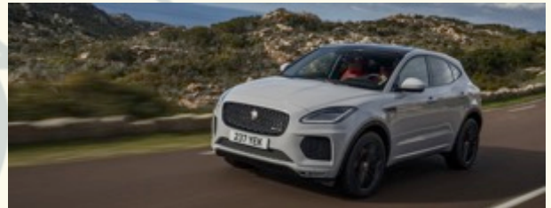
Jaguar E-PACE feiert Markteinführung in Deutschland und Österreich (Seite 5)